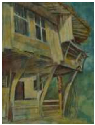
ЖЕРАВНА КЪЩАТА НА ХАВЕЗОВ – 40/30