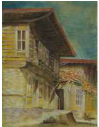
ЖЕРАВНА ОТВОРЕНА ВРАТА – 40/30