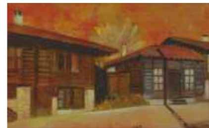
МЕДВЕНСКА УЛИЦА – 25/40