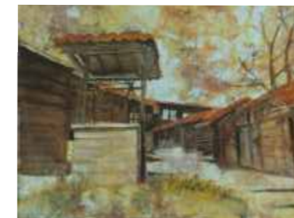
ИЧЕРА-КЛАДЕНЕЦ – 27/32