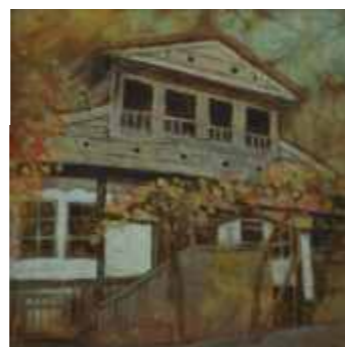
ЖЕРАВНА КЪЩАТА НА ПОП ТОДОР 30/30