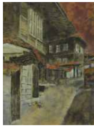
КОТЛЕНСКА АТМОСФЕРА – 40/30