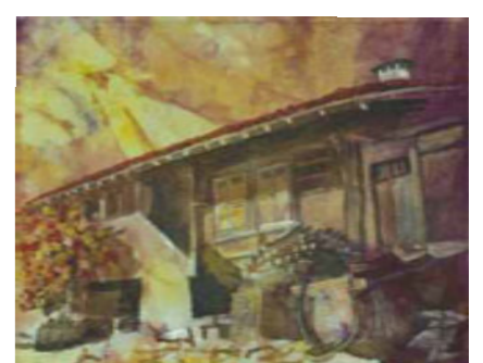
ЖЕРАВНА-ПОСТОЛОВА КЪЩА – 34/27