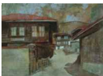
КОТЕЛ-КЪОРПЕЕВА КЪЩА – 32/24