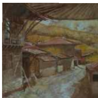
ЖЕРАВНА ПОД СТЯХАТА 30/30