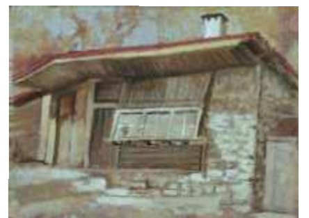
ЖЕРАВНА -ФУРНАТА – 24/32