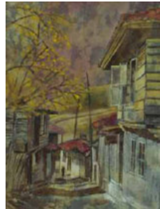
КОТЕЛ ОТВОРЕН ПРОЗОРЕЦ – 40/30