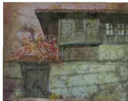
МЕДВЕН-СТАРА КЪЩА – 32/24