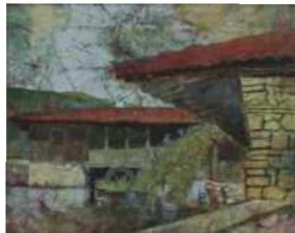
КОТЕЛ-ВОДЕНИЦАТА – 34/27