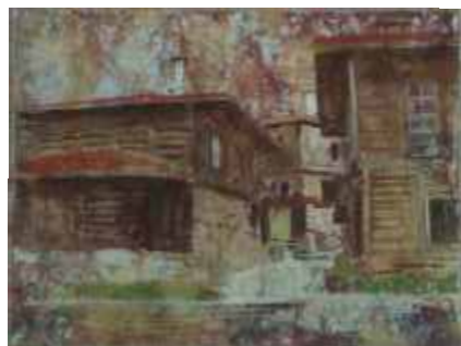
МЕДВЕН-ПО СТЬЛБИТЕ – 32/24