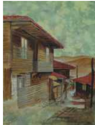
КОТЕЛ КЪМ ПЛАНИНАТА – 40/30