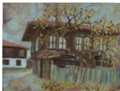
МЕДВЕН-ДВОР – 24/32