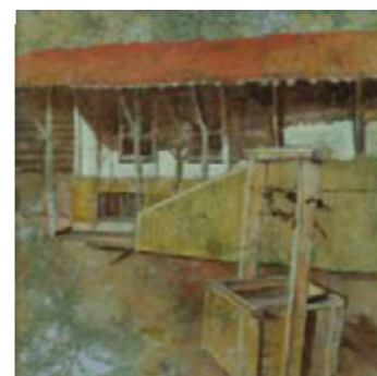
КЛАДЕНЕЦА НА РУСИ ЧОРБАДЖИ 30/30