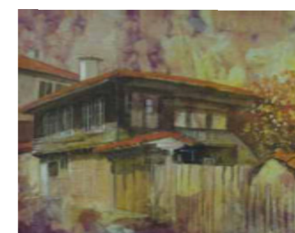
МЕДВЕНСКА ПОРТА 34/27