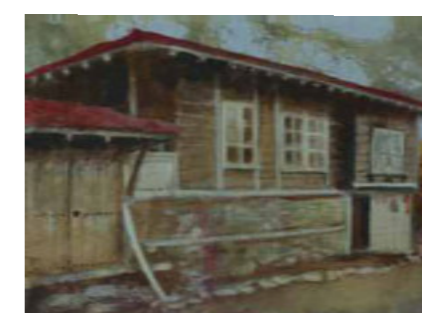
КЪЩАТА НА БАБА ПАНОВИЦА– 32/24