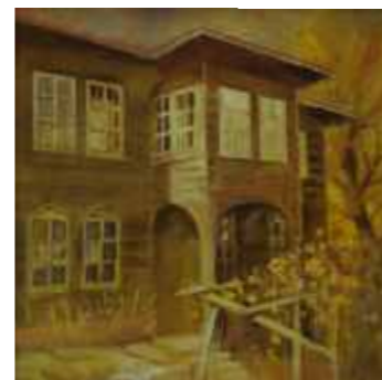
ЖЕРАВНА КЪЩАТА НА САВО СТОЙНОВ 30/30