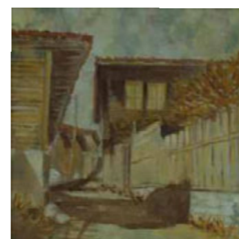
КОТЛЕНСКА ОГРАДА 30/30