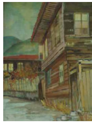
КОТЕЛ МЕНЦИ НА ПРАГА – 40/30