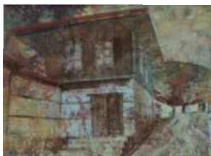
ЖЕРАВНА-ХРАМЪТ – 24/32