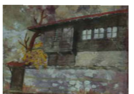
ЕСЕН В МЕДВЕН – 32/24